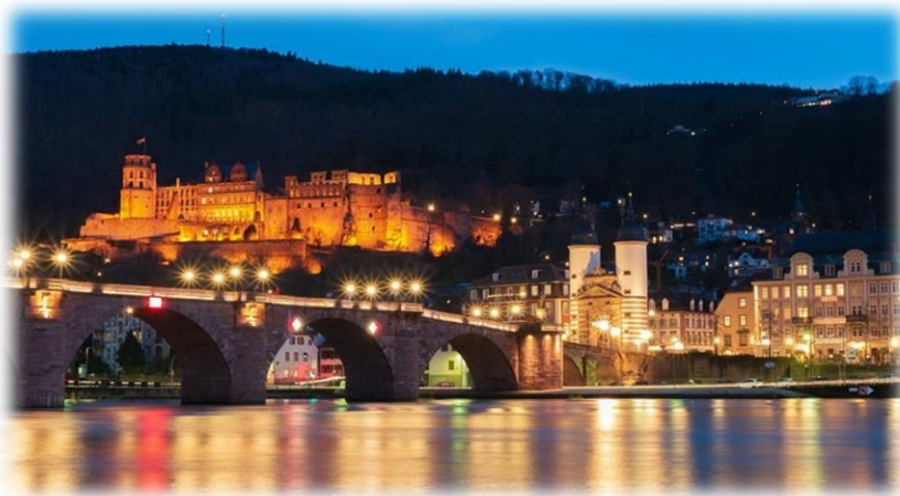
Heidelberg bei Nacht

Direkt nach dem Frühstück erwartet Sie einer unserer beliebten, örtlichen Reiseleitungen zu einem ca. 1,5-stündigen Altstadtrundgang . Tauchen Sie ein in die Geschichte der romantischen Stadt am Neckar mit Deutschlands ältester Universität . Mit zahlreichen Reiseerinnerungen im Gepäck treten Sie nun die Heimreise an.