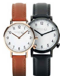
Uhr mit Notrufknopf (Elegance)