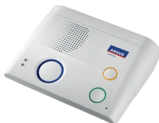
Basisstation (inkl. Freisprecheinrichtung)